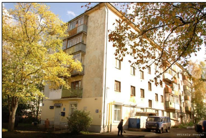
Дом, где жил Н. Рубцов

На следующий день гости фестиваля совершили на автобусе экскурсию по памятным местам Николая Рубцова в городе Вологде «Душа хранит». Они побывали возле дома, в однокомнатной квартире на пятом этаже которого жил и погиб выдающийся русский поэт.