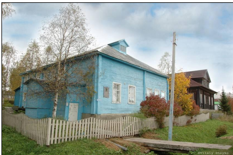
Детский дом в селе Никольское

Такой же вечер прошёл и в селе Николе, куда сразу же отправились артисты. Именно сюда, в детский дом, семилетний Коля Рубцов попал после смерти матери и ухода отца на фронт осенью 1943 года. Здесь в двухэтажной деревянной школе учился будущий поэт, проживая на втором этаже в одной из комнат. В детском доме прошли его 7 детских и отроческих лет. С 1990 года этот детский дом стал мемориальным музеем имени Н.М. Рубцова.